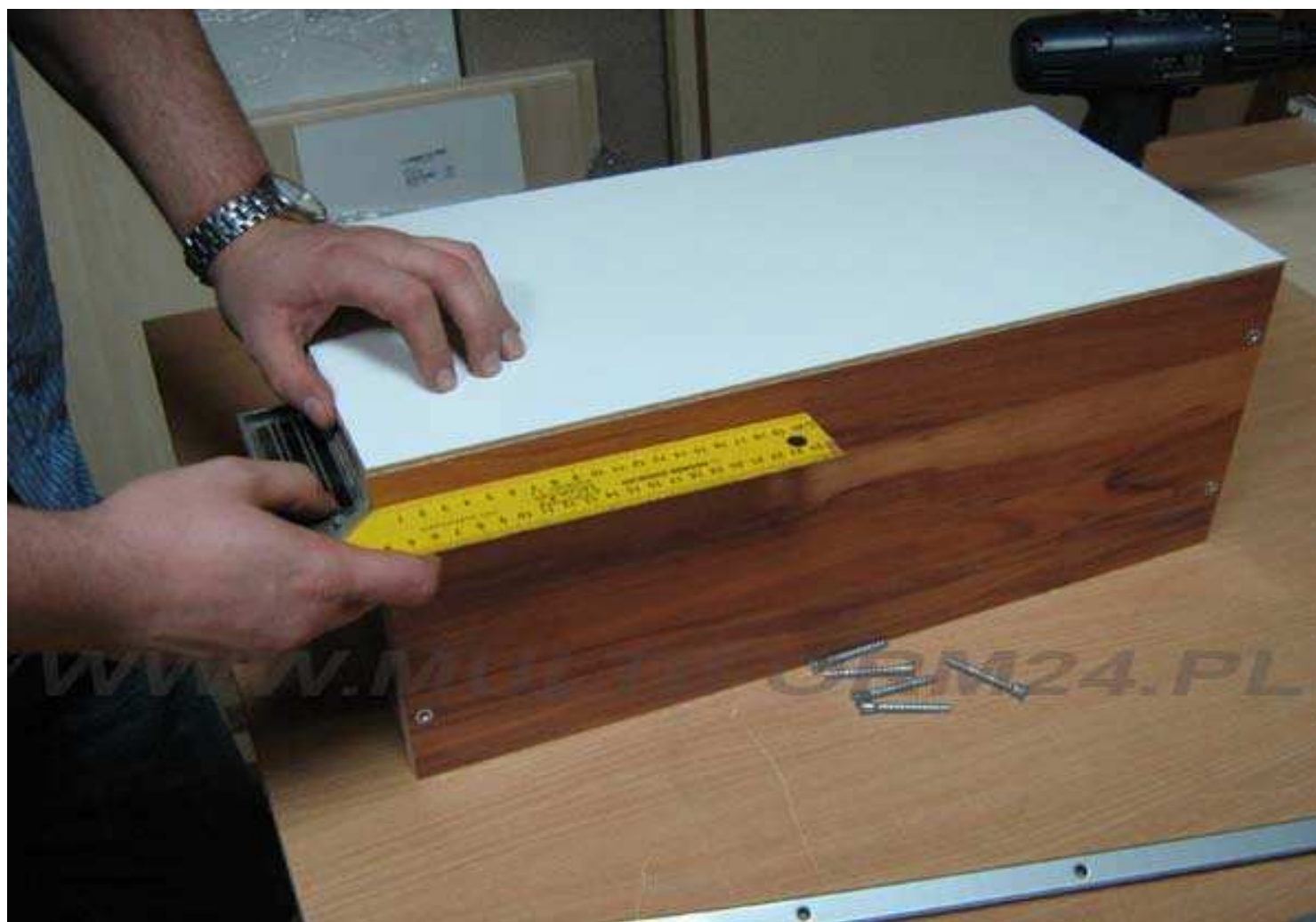
Kontrola kątów prostych.