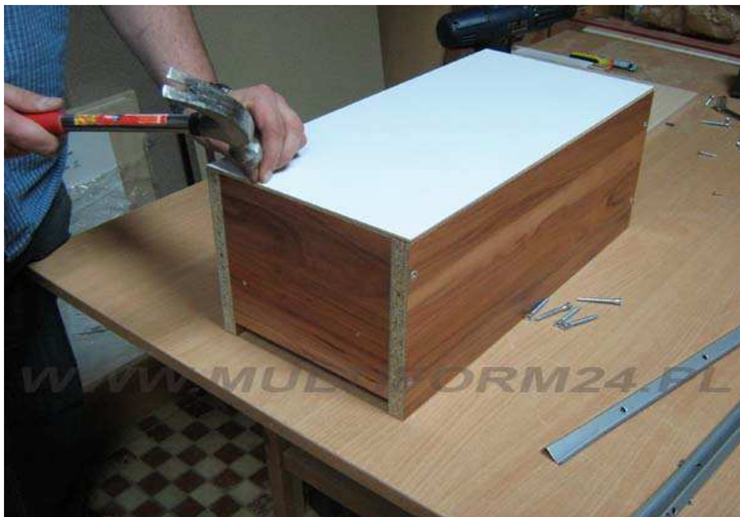
Mocujemy dno gwóźdzkami wstępnie.